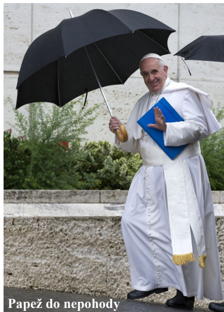
Papež do nepohody

Třináctého března uplyne deset let pontifikátu papeže Františka, desetiletí církevních reforem a obnovy, během něhož došlo k posunu priorit směrem k církvi, která více zahrnuje chudé, ženy, vysídlené a marginalizované osoby, k církvi, která více pečuje o stvoření a je otevřená mezináboženskému dialogu, k církvi, která je více synodální a milosrdnější.